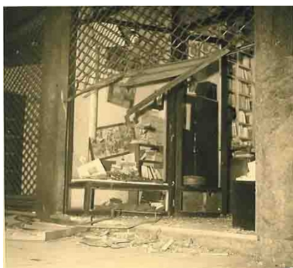
La librairie Les Vraies richesses, en novembre 1961, après son plasticage par l'OAS (Organisation Armée Secrète)