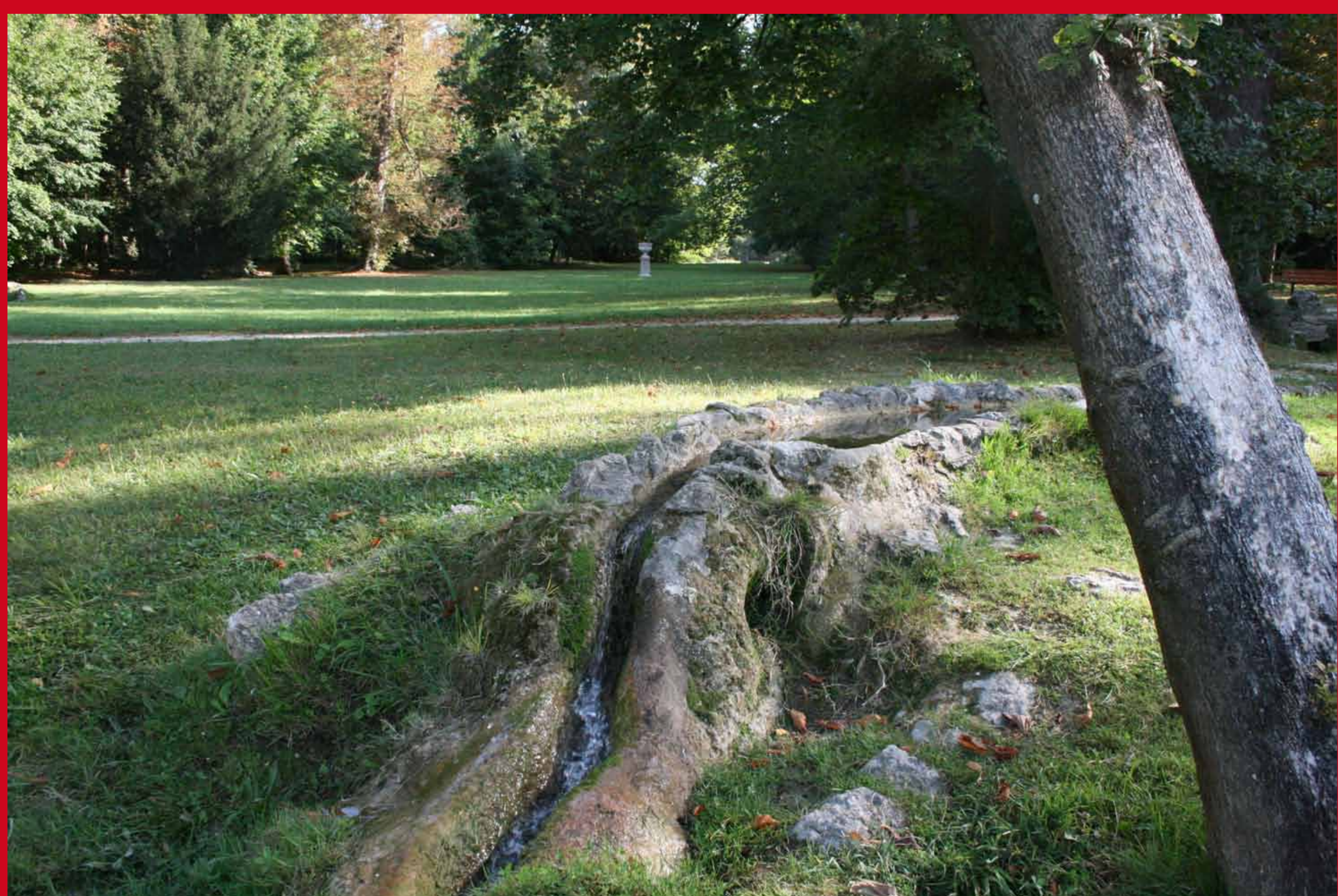
Les «catanas» d'eau