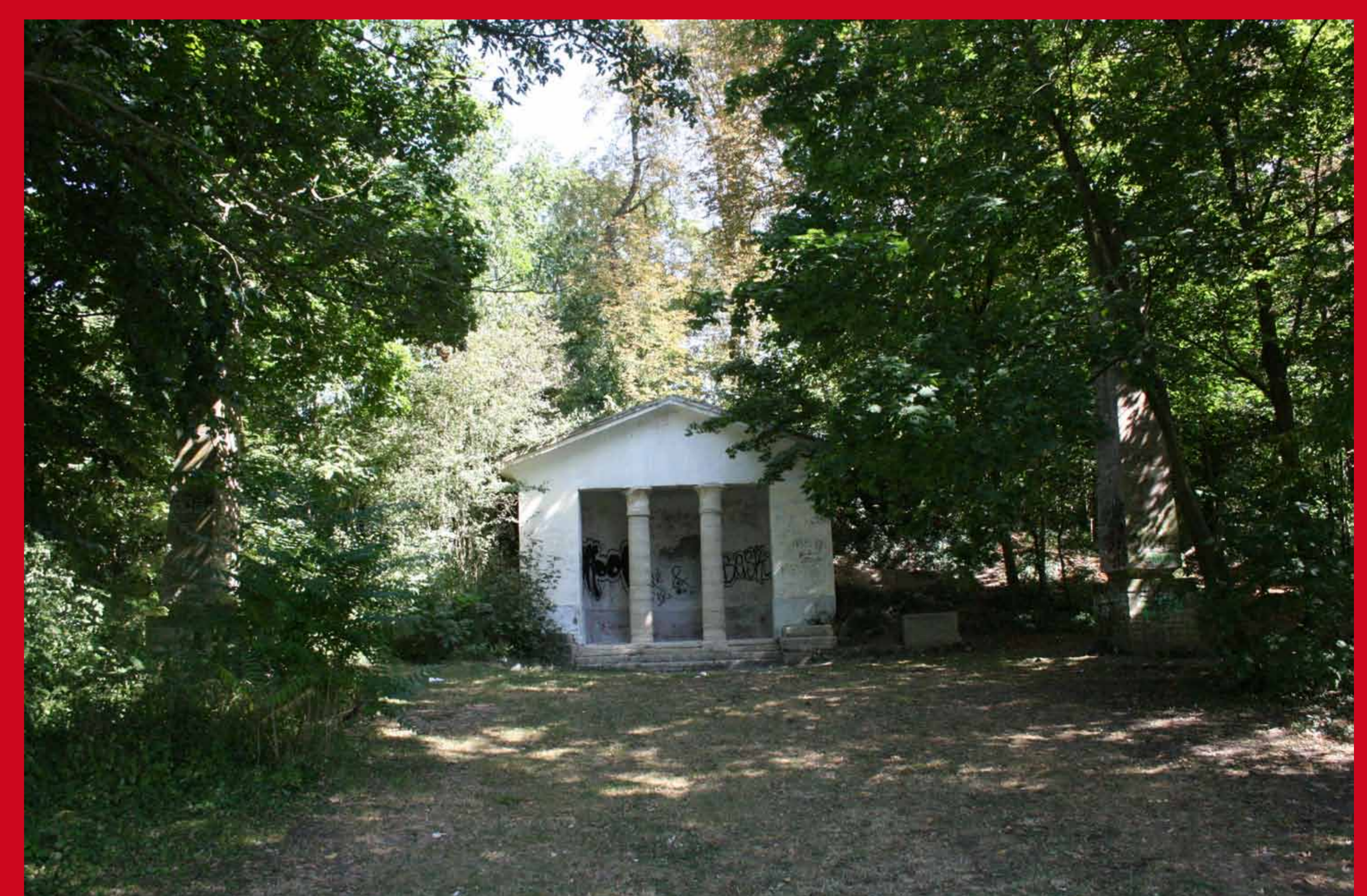
Le temple égyptien