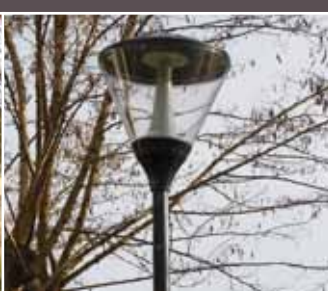
> Autres travaux : Le nouvel éclairage du Chemin rural du Grand Veneur

Afin d'améliorer et de sécuriser la circulation des piétons, à la nuit tombée, 14 nouveaux candélabres ont été installés sur le chemin rural du Grand Veneur (5 sur la première section entre la rue de l'Ermitage et la rue Jean de La Fontaine, 9 sur la seconde section entre la rue Jean de La Fontaine et la rue François Villon). À noter que l'intensité lumineuse de ces candélabres sera réduite dans les prochains jours pour limiter la gêne de certains riverains.