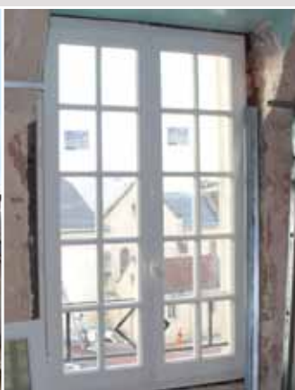
> Rénovation complète du Château des Chenevières - Rénovation des planchers, - Remplacement des menuiseries.