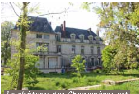
Le château des Chenevières est en cours de rénovation. Ces travaux devraient se terminer avec la création d'un parvis en fin d'année 2018

Plus d'un an et demi de travaux à venir !