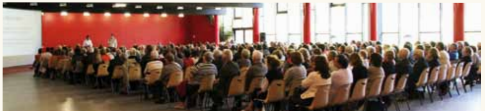
Une réunion publique en présence de plus de 300 personnes, et des élus locaux