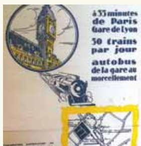
1929 : Publicité pour la commercialisation de lotissements à Soisy-sur-Seine