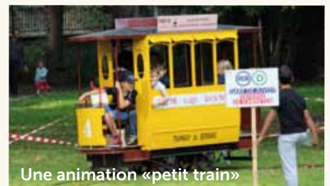
Une animation «petit train»