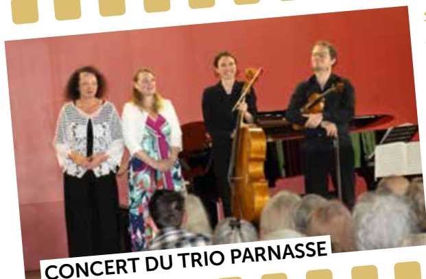
CONCERT DU TRIO PARNASSE