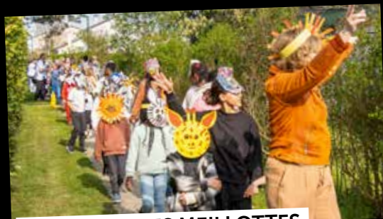
CARNAVAL DES MEILLOTES

20 mars : de nombreux Soisédiens ont assisté au conseil municipal d'installation, en salle du Grand Veneur. (article pages 4-5)