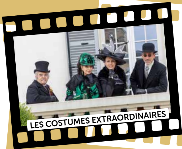
LES COSTUMES EXTRAORDINAIRES

12 avril : la Balade des costumes extraordinaires a animé le parvis de la mairie le matin, puis le parc du Grand Veneur l'après-midi, au son de l'orchestre du conservatoire municipal.