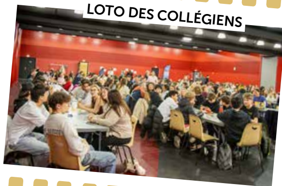
LOTO DES COLLÉGIENS

27 mars : la salle était comble pour le désormais traditionnel loto des collégiens, organisé par la fédération des parents d'élèves PEEP du collège de l'Ermitage.