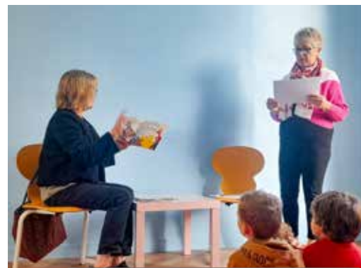
Les bénévoles de lire et faire lire en pleine lecture

> Contact : Marie-Jeanne BRUZAT > Tél. 06 88 57 43 70