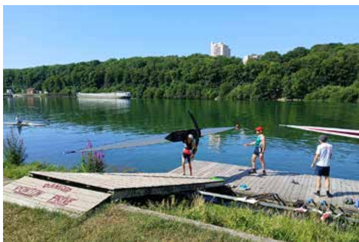
La Seine, un cadre privilégié pour la pratique de l'aviron

Le club d'aviron de Soisy franchit une nouvelle étape dans son développement. L'association vient d'obtenir le label « École Française d'Aviron » pour l'année 2026, une reconnaissance délivrée par la Fédération Française d'Aviron qui valorise la qualité de l'accueil et de l'encadrement proposés aux pratiquants.