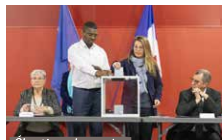
Élection du maire