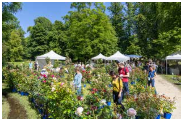
La roseraie éphémère installée en 2025 sera de retour pour cette nouvelle édition

_Le printemps s'installe à Soisy et annonce avec lui le retour de la Fête des jardins ! Les samedi 9 et dimanche 10 mai, une quarantaine d'exposants investira le parc du Grand Veneur pour proposer fleurs, plantes, créations artisanales, objets de décoration, produits bien-être et spécialités gourmandes.