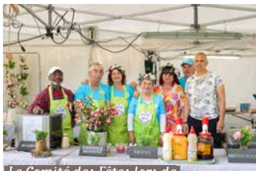
Le Comité des Fêtes lors de la Fête des jardins

E nvie de vous investir dans la vie locale et de partager des moments conviviaux ? Le Comité des Fêtes de Soisy recherche de nouveaux bénévoles pour faire vivre ses animations tout au long de l'année.