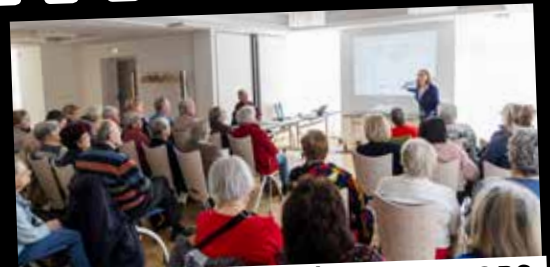
PRÉSENTATION DU SÉJOUR SENIORS

11 avril : lors du 2e atelier jardinage organisé par la médiathèque avec l'association des Jardiniers d'Étiolles, les enfants ont participé à la plantation de jeunes plants au potager du Grand Veneur.