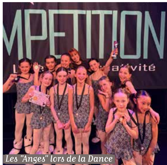
Les "Anges" lors de la Dance area competition

La Ville adresse ses félicitations à ces jeunes talents qui contribuent, déjà, à faire rayonner Soisy-sur-Seine.