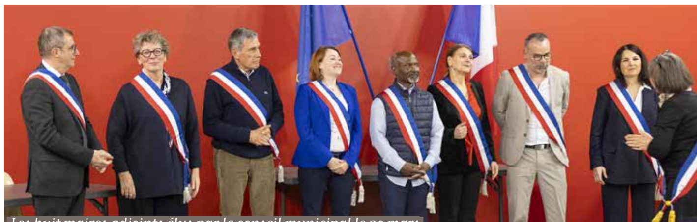
Les huit maires adjoints élus par le conseil municipal le 20 mars

Les représentants de Soisy-sur-Seine participent aux décisions prises à cette échelle, en complément de l'action municipale.