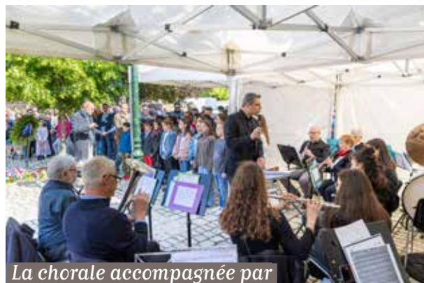
La chorale accompagnée par l'orchestre du conservatoire en 2025

Un hommage sera également rendu au sous-lieutenant Jean Valayer, Soiséen mort pour la France le 9 avril 1945, rappelant le courage et l'engagement de celles et ceux qui ont combattu pour la liberté.