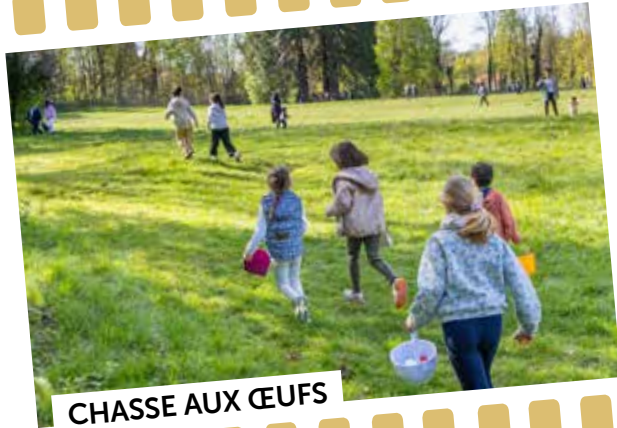
CHASSE AUX ŒUFS

6 avril : par une matinée ensoleillée, environ 600 enfants ont participé à la traditionnelle chasse aux œufs organisée par la Ville au parc du Grand Veneur.